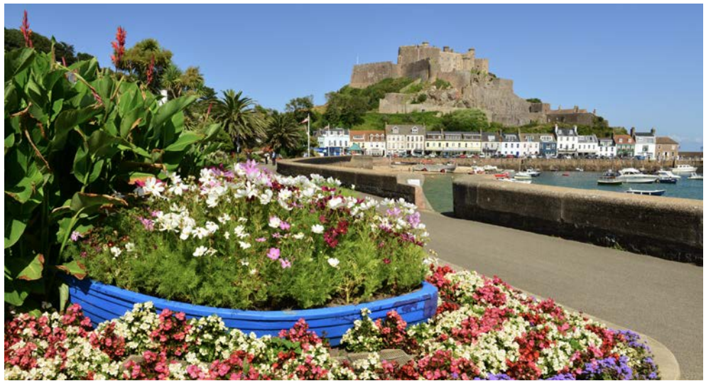
Mont Orgueil Castle

Der Südküste entlang geht's nach Osten zum „Mont Orgueil Castle“, das spektakulär über dem malerischen Städtchen Gorey thront; nach der Besichtigung führt die Fahrt die Ostküste entlang, wo der gigantische Tidenhub von 12 Metern besonders beeindruckende Wattlandschaften zaubert: mit kantigen Riffen aus schwarz glänzendem Granit, sich in der Sonne spiegelnden Wasserstellen und vom Meer geschaffenen Prielen. Vorbei am „Archirondel Tower“, einem Wachturm von 1792, und der 600 m langen Mole „St. Catherine's Breakwater“ (Sie können hier gerne hinaus aufs Meer laufen) fahren Sie zu einem Pub, in dem Sie den