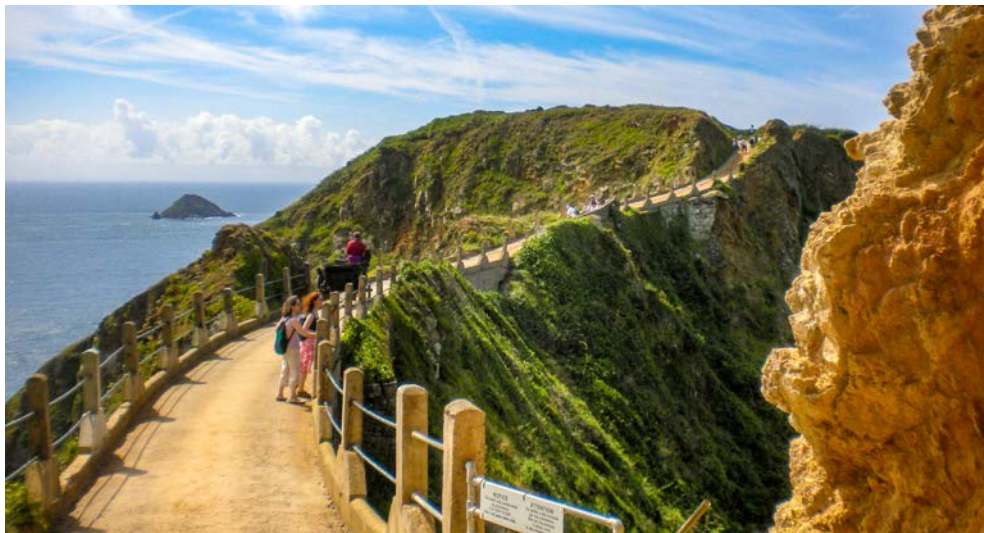
La Coupée – spektakulärer Übergang zwischen Sark und Little Sark

Anwesens Samares Manor, einem der wenigen öffentlich zugänglichen Feudalsitze, der Sie mit kunstvoll angelegten Gärten beeindruckt wird. Neben dem japanischen Garten, dem Wasser- und Felsgarten besticht besonders der duftende Kräutergarten, der als einer der größten in Großbritannien gilt.