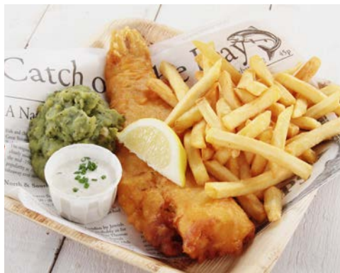
Fish & Chips - einfach lecker!

ein Stück Frankreich, das ins Meer gefallen ist und von England aufgesammelt wurde: So beschrieb Victor Hugo die Kanalinseln. Aus dem Spannungsfeld zwischen den beiden großen Kulturnationen ergeben sich immer wieder faszinierende und anziehende Gegensätze: zum Beispiel französischer Charme und britische Exzentrik, Herrenhäuser in viktorianischem oder Tudorstil und normannische Bauernhäuser, die exzellente französische Küche und Fish & Chips am Meer. Wer Kulturdenkmäler sucht, findet sie in überreichem Maße: von Menhiren über mittelalterliche Burgen bis zu Relikten aus dem 2. Weltkrieg. Für Naturfreunde sind die Inseln ebenfalls kleine Paradiese. Endlos weite weiße Sandstrände wechseln sich mit spektakulären, schroffen Klippen ab. Auf den Inseln wachsen (dem Golfstrom sei Dank) Palmen, genauso wie Hortensien, üppige Rosen, Ginseng, Mimosen und Kamelien. Aber das vielleicht Schönste ist, dass hier Entdecker unter sich sind, weil die Kanalinseln vom Massentourismus bis jetzt immer noch verschont geblieben.