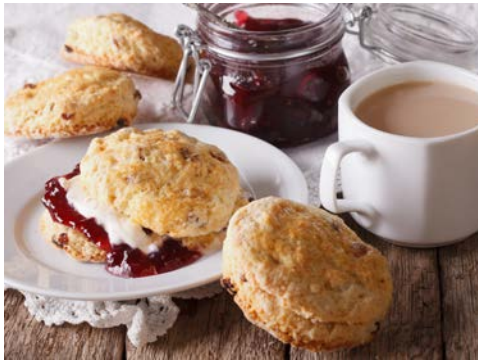
Scones mit Cream Tea – einfach lecker

Das Hotel Pomme d'Or (Landeskategorie: 4 Sterne) ist direkt im Herzen von St. Helier gelegen und somit ein idealer Ausgangspunkt für Erkundungen. Vom Hotelrestaurant aus genießen Sie den wunderschönen Blick über den Liberation Square bis hin zum Yachthafen. Das Hotel verfügt über das „Harbour Room“ Restaurant sowie eine Café-Bar in der Stadt. Sie können außerdem die Badelandschaft des rund 15 Gehminuten entfernten Schwester-Hotels „The Merton“ kostenfrei nutzen (bei Interesse wenden Sie sich bitte an die Rezeption des Pomme d'Or). Die Zimmer sind komfortabel und mit LCD-TV, Telefon, Klimaanlage sowie einem Kaffee-/Teezubereiter, Bad und Haartrockner ausgestattet.