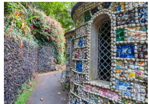
Detailsicht der Little Chapel auf Guernsey

der Kanalinseln empfängt Sie in Guernseys fantastischer Inselhauptstadt St. Peter Port. Bei einem geführten Stadtrundgang durch die verwinkelten Kopfsteinpflastergassen genießen Sie das unverwechselbare Flair des charmanten Städtchens. Am Nachmittag unternehmen Sie eine Inselrundfahrt Richtung Norden – die ungezählten Buchten sind noch genauso malerisch wie 1883, als Auguste Renoir sie in Öl malte. Im Inselinneren erwartet Sie „Little Chapel“, die wohl kleinste Kirche der Welt. Sie wurde als Miniaturausgabe der Kirche von Lourdes erbaut und ist mit Muscheln, bunten Porzellanscherben und Kieselsteinen übersät. Nach der Fahrt durch Fort George, wo die Schönen und Reichen wohnen, erreichen Sie wieder St. Peter Port, wo die Fähre Sie zurück nach Jersey bringt.